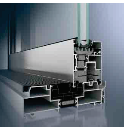
Schüco Hebe-Schiebesystem ASS 70.HI Schüco lift-and-slide system ASS 70.HI